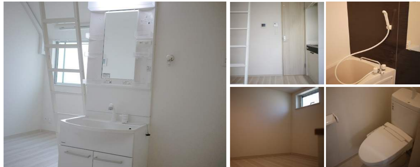
※図面と現況が相違する場合は現況優先とします。